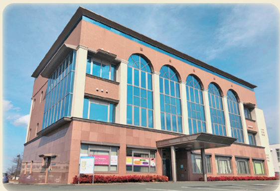
公益社団法人山形県看護協会 山形県ナースセンター

看護の質の向上、働き続けられる環境づくりを推進し、専門職としてのキャリア継続と生涯学習の支援を行い、人々の健康な生活の実現に寄与することを目的とし活動しています。