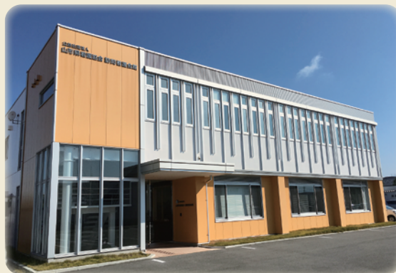
訪問看護ステーションやまがた 山形県訪問看護総合支援センター

地域の訪問看護に関わる様々な問題に取り組み、在宅療養者や家族が安心して生活できるよう、訪問看護の周知・利用促進を目指して活動しています。