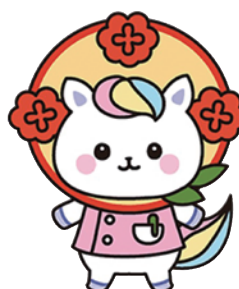
かんごちゃん 「看護の日」キャラクター (山形県バージョン)

Y amagata ⇒ Yは“夢” N ursing ⇒ Nは“ナーシング” A ssociation ⇒ Aは“愛”